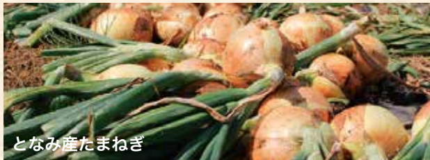
となみ産たまねぎ