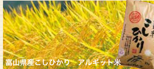
富山県産こしひかり アルギット米